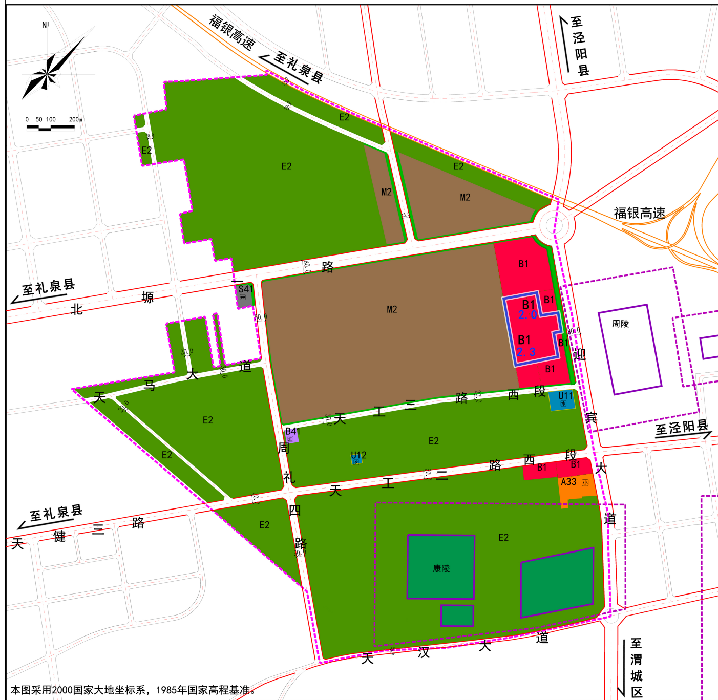
XXQH-ZL03管理单元土地利用规划图（修改前）