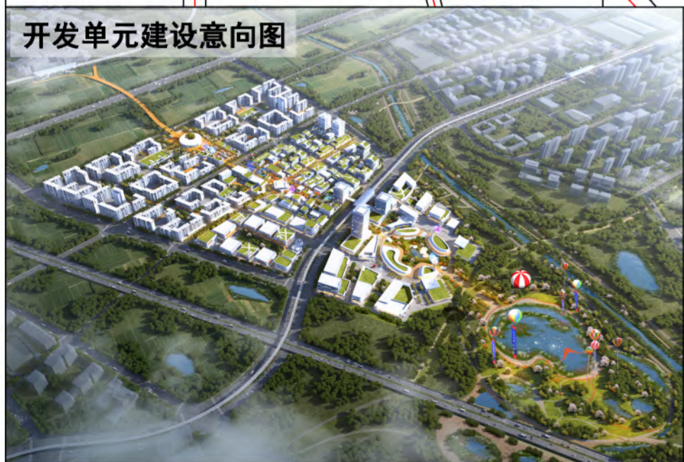
开发单元建设意向图

备注：在地块04内设置一处总建筑面积约1.8万平方米的综合型文体活动中心。在地块02、06、16内设置三处5G基站。