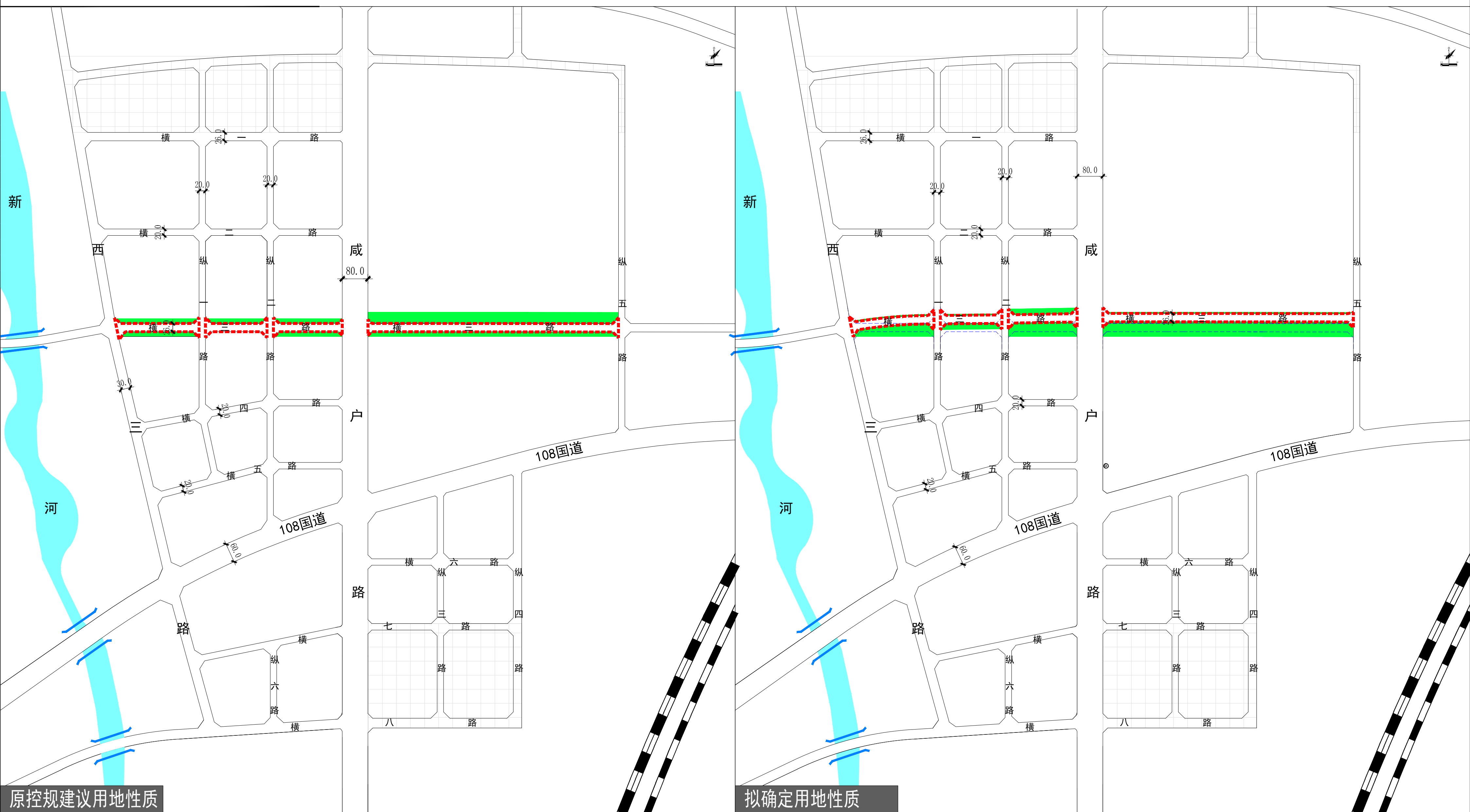
西咸新区沣西新城横三路用地控制图