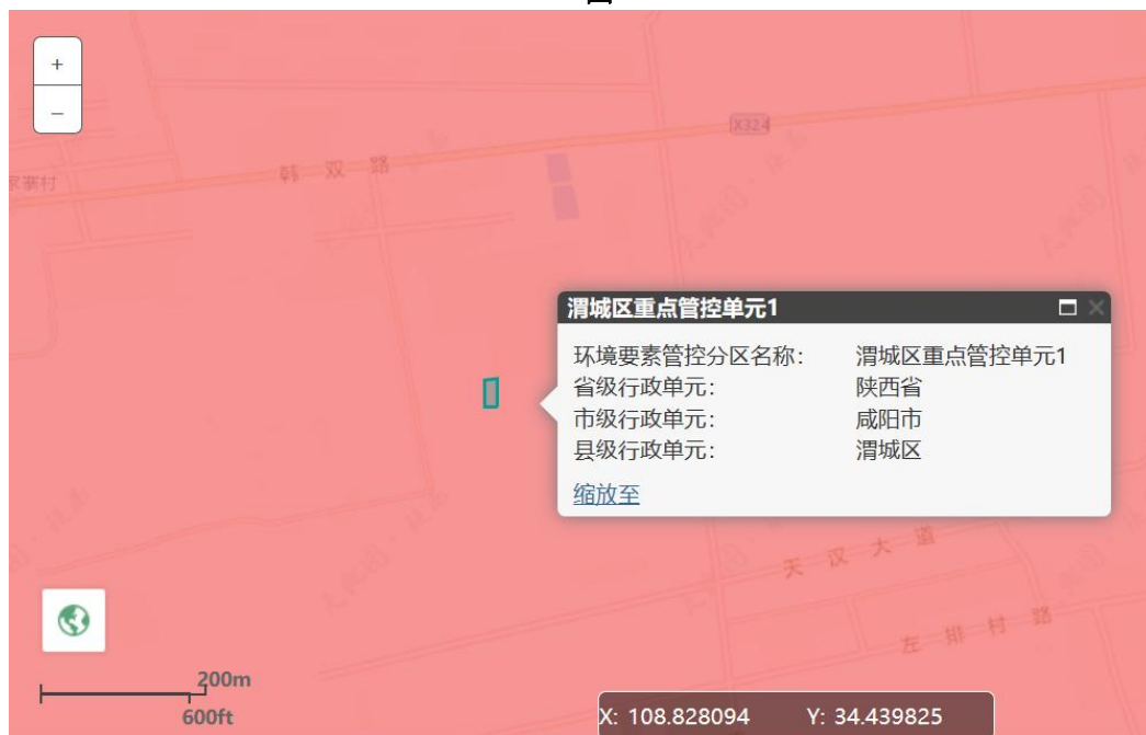
项目地与重点管控单元的位置示意图