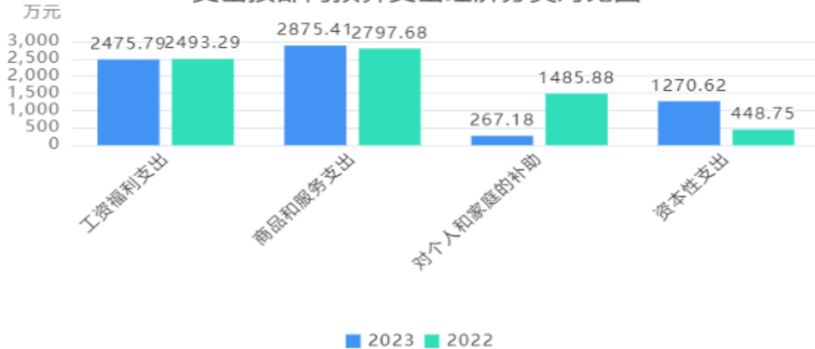
支出按部门预算支出经济分类对比图