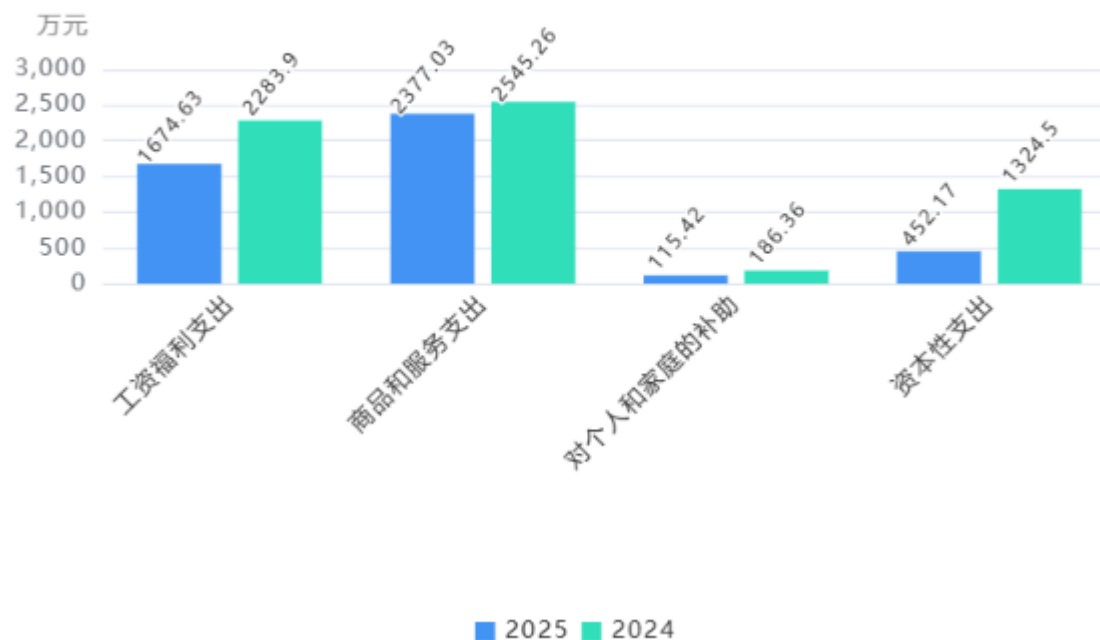
支出按部门预算支出经济分类对比图

2. 按照政府预算支出经济分类，本单位当年一般公共预算支出4,619.25万元，其中：