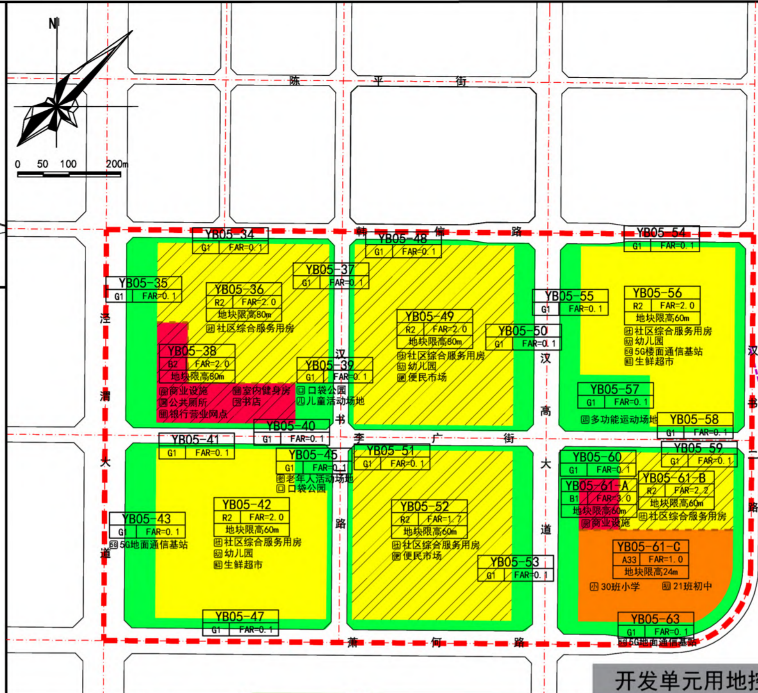
开发单元用地控制图

开发单元控制初中、小学、幼儿园、口袋公园、儿童活动场地、老年人活动场地、多功能运动场地、商业设施、便民市场、室内健身房、书店（社区书屋）、生鲜超市、银行营业网点、5G基站等9项设施。（具体如右图及右表所示）