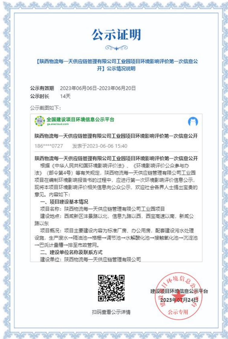
图 2-1 首次环境影响评价信息网络公示截图