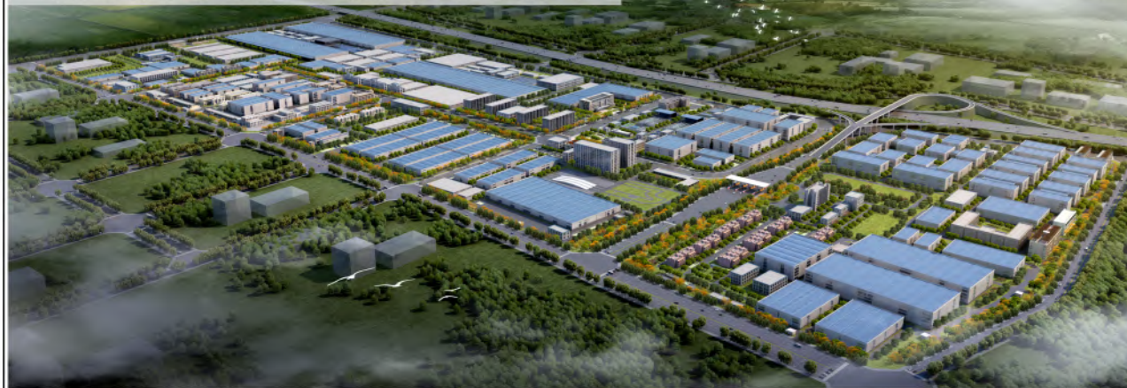
开发单元城市设计示意图