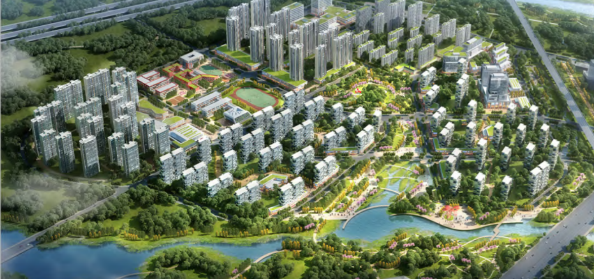
开发单元建设意象图