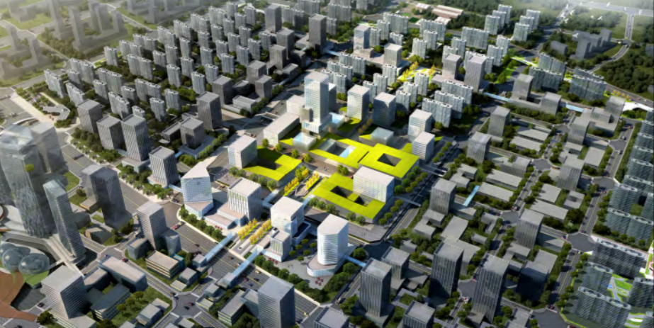
开发单元建设意向图