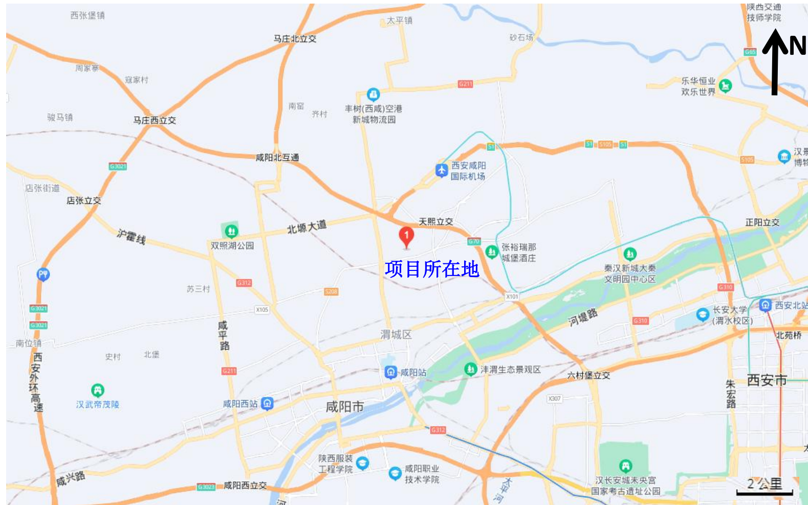
附图一：本项目地理位置图